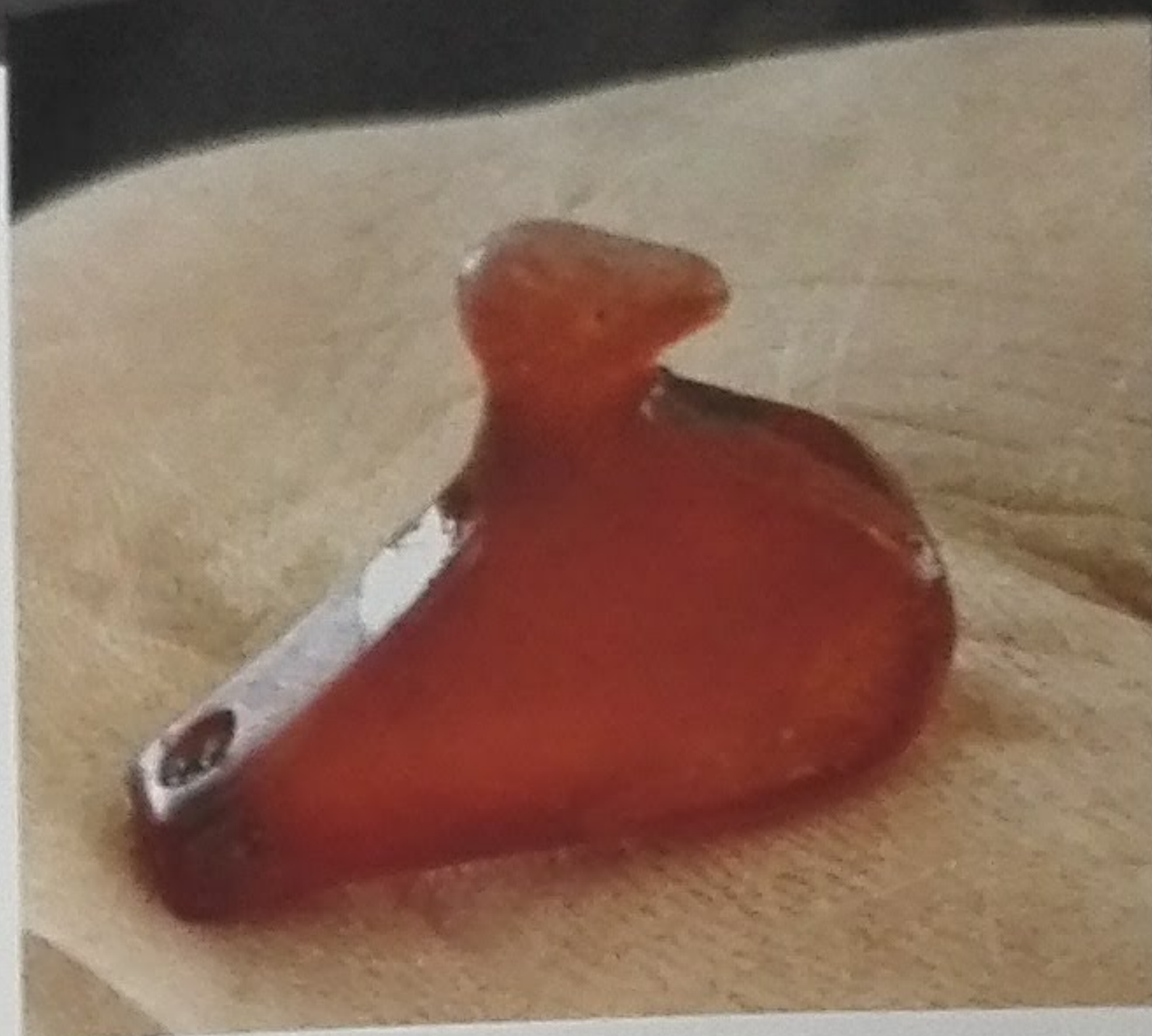
Vogeltje in barnsteent

Pieterjan – "Mijn taak momenteel is meewerken op het terrein met de Deense archeologen. We bouwen bijvoorbeeld gaandeweg een 3D-model van de volledige stratigrafie op door elke laag met onze totalstation en laserscanner te scannen. We zeven ook routineus alle grond die van de site komt, omdat veel kleine vondsten, zoals scattas en glazen kralen, tijdens het graven gemakkelijk over het hoofd kunnen worden gezien. Na afloop van het jaar terreinwerk ben ik samen met Sarah Croix verantwoordelijk voor de wetenschappelijke publicatie van de opgraving. Dat wordt een uitdaging, want er moet vanuit de inbreng van heel verschillende natuurwetenschappelijke disciplines een samenhangend verhaal worden gesmeed."