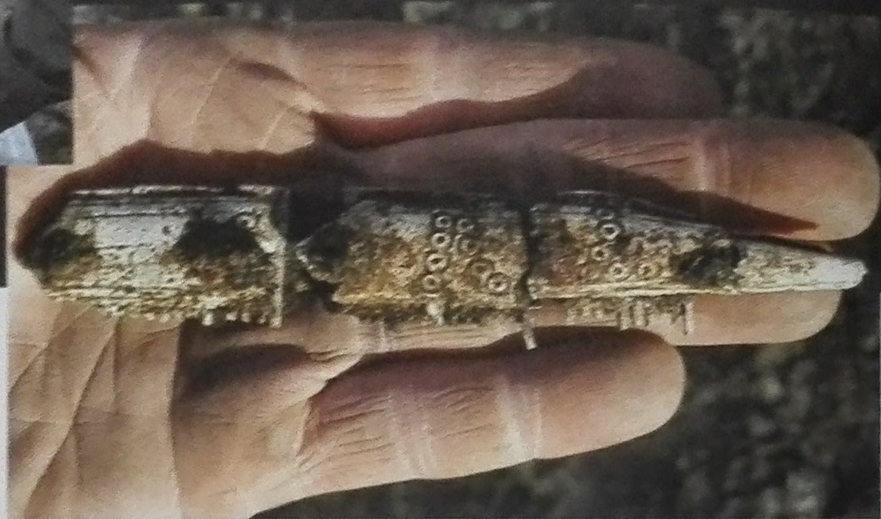
Benen van die in Denemarken het nationale nieuws haalde. Ook CNN en National Geographic publiceerden al over de site, en eind maart kregen de archeologen een onofficieel bezoek van de Deense koningin Margrethe, van opleiding zelf archeologe

"Hygge, de Deense gezelligheid, is bij ons misschien een trendy marketing-truc, maar hier is het een heel serieuze zaak."