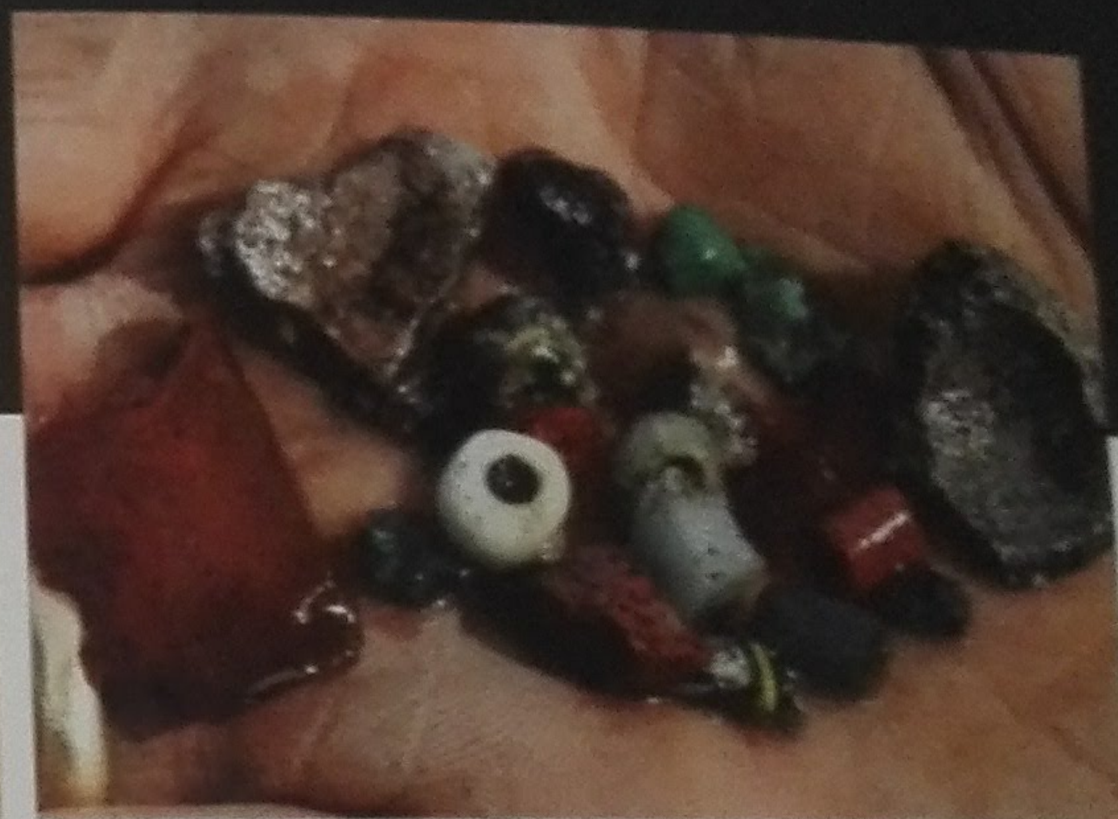
Vondsten uit de zeeff zoals talrijke gekleurde glaskralen en barnsteentagments

"We lachen er wel eens mee dat wij als onderzoekers uit Frankenland nu als slaven moeten labeuren voor onze Vikingheren."