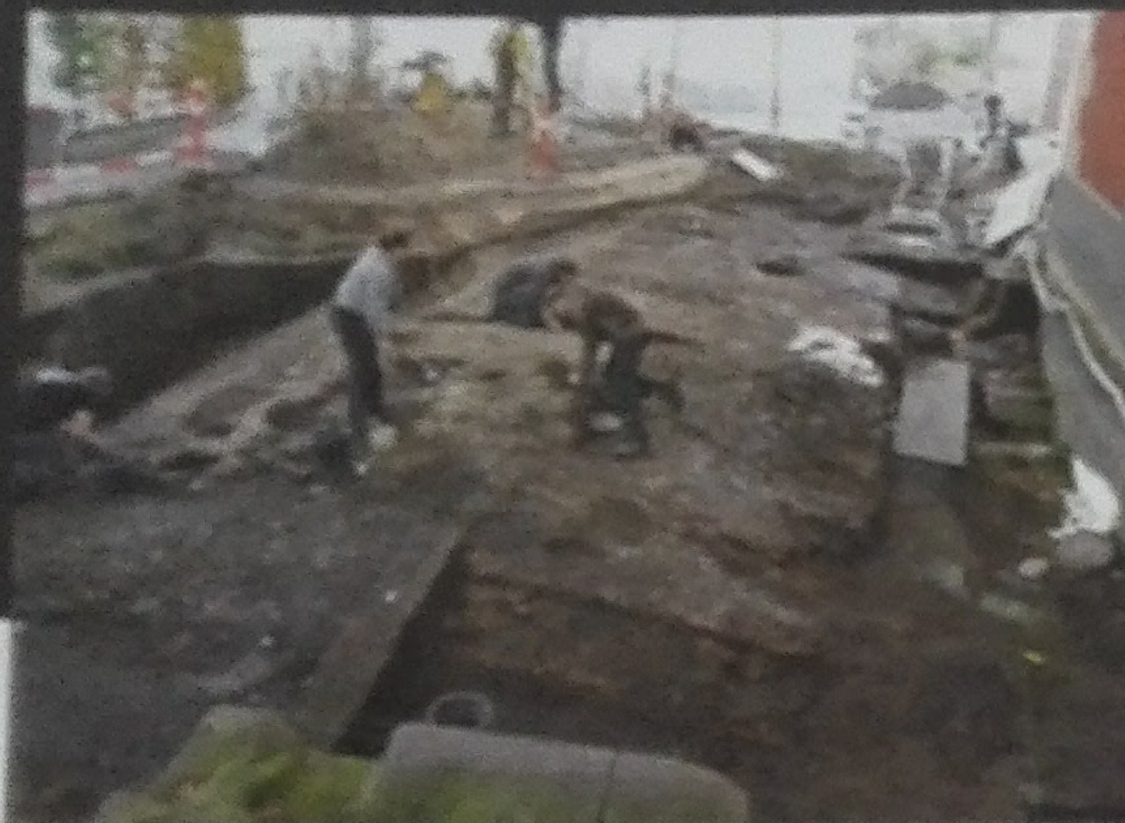
Een Vikinghuis uit de 9de eeuw met een kleivloer en verschillende vertrekken. Op de voorgrond de voorgevel en de straat, aan weerszijden van het huis een gracht